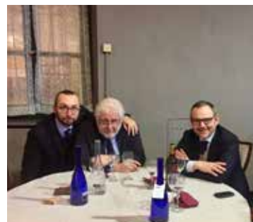
Alcuni nostri soci durante la serata