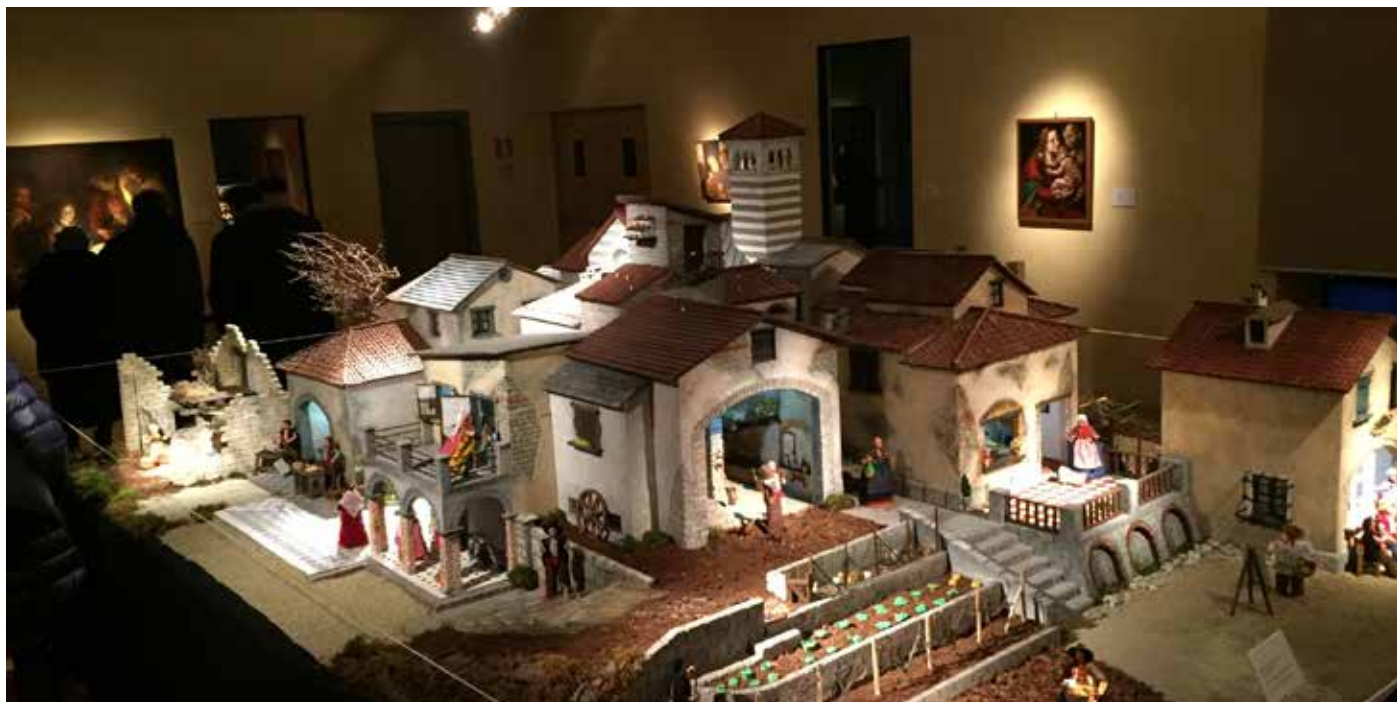
Una foto di una delle opere presenti al Museo dei beni culturali Cappuccini