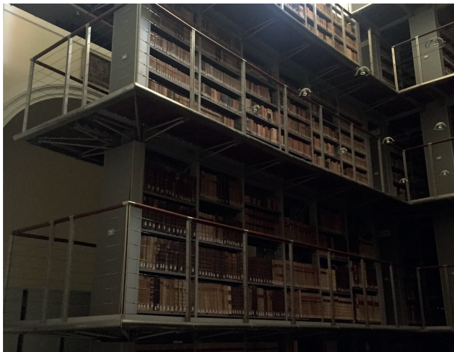
Sopra un dettaglio della biblioteca, a lato una delle sculture presenti nella chiesa