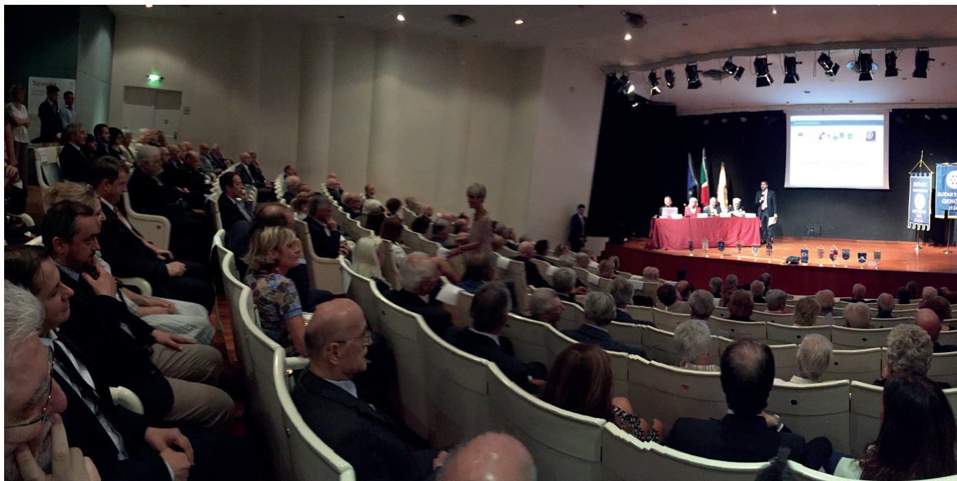
Sopra un'immagine dell'Auditorium gremito, sotto i nostri due presidenti