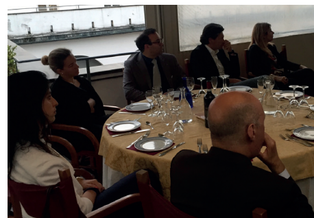
Sopra i relatori della serata attorno al nostro Presidente, a lato alcuni soci del nostro club durante le relazioni