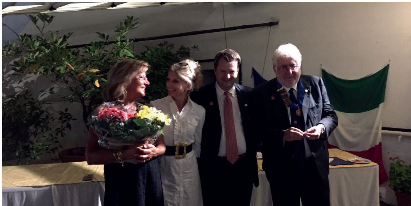
Sopra i presidenti durante il passaggio delle consegne, sotto un momento della serata