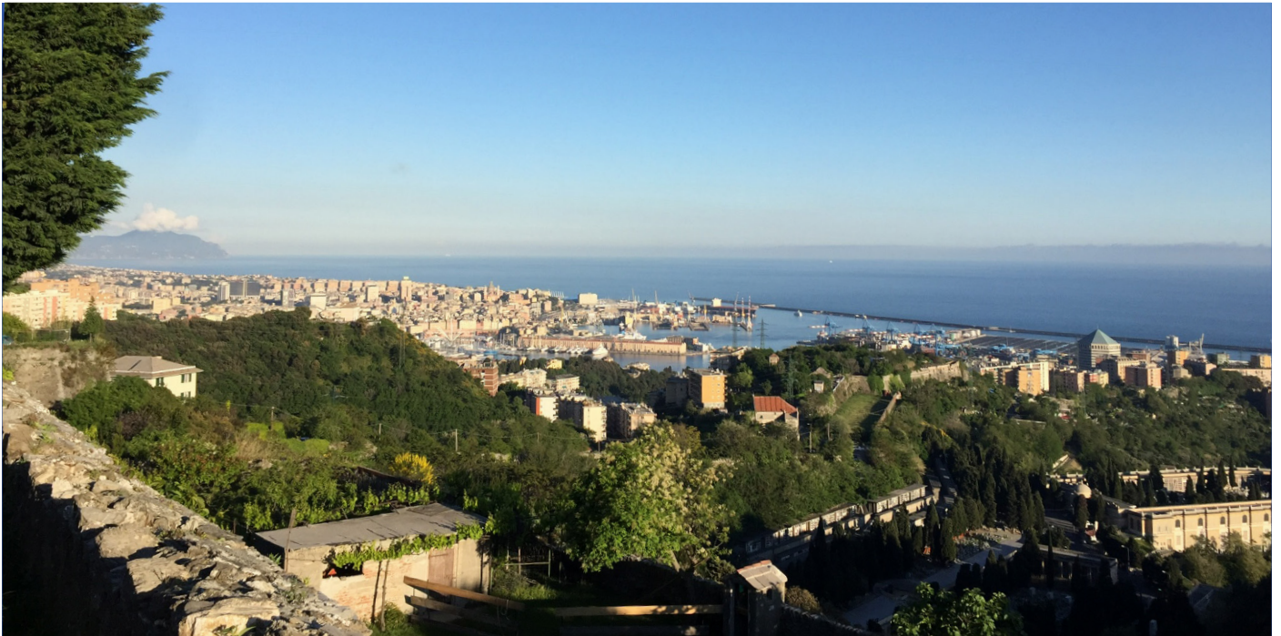
Sopra una suggestiva immagine del panorama che si può ammirare da Forte Tenagli, sotto la targa per del nostro service del 2016