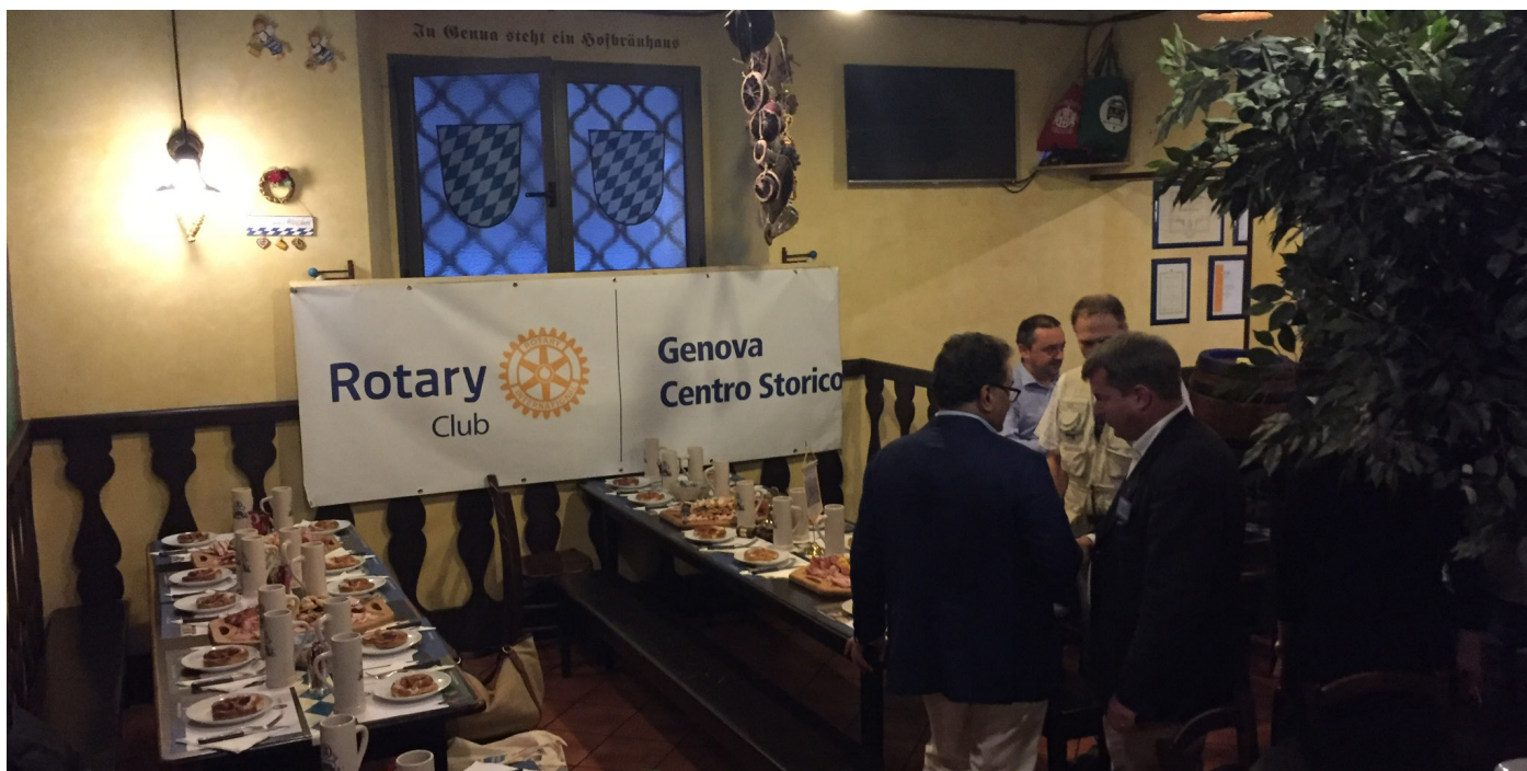
Sopra uno dei momenti della serata con il nostro poster sullo sfondo, sotto il momento della consegna di parte dei nostri contributi per l'Associazione S. Marcellino

Serata di affiatamento con cena tipica bavarese