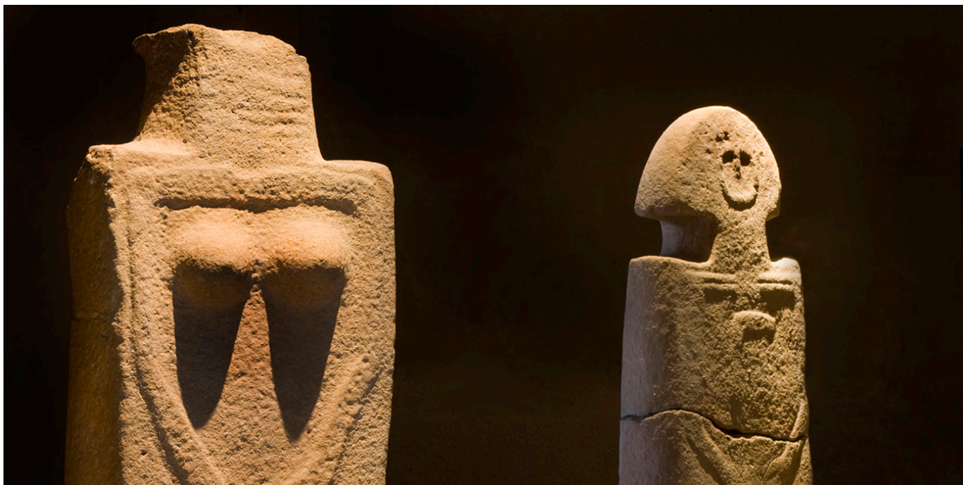
Le statue-stele in arenaria sono il simbolo della Lunigiana, realizzate dal IV millennio al VI secolo a.C.

Presentazione del libro a cura del RC Lunigiana