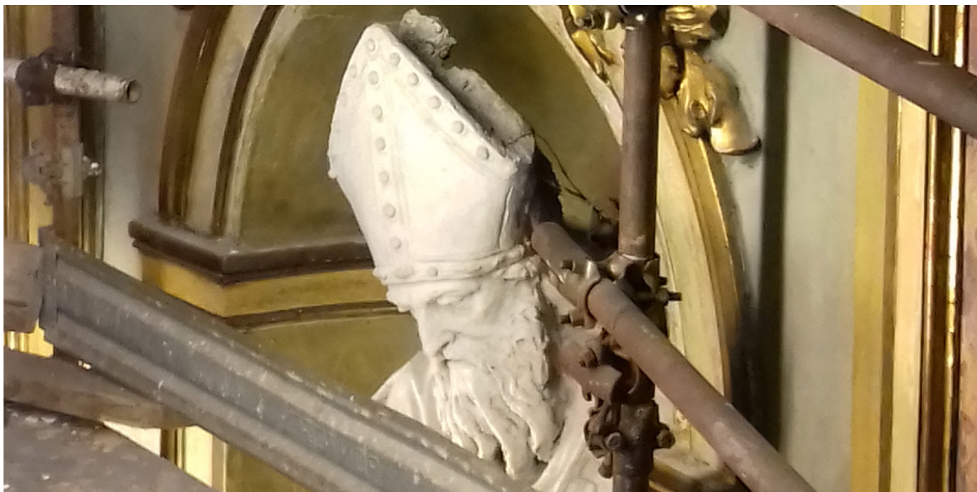
Una delle opere che si trova nella Chiesa