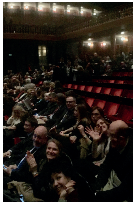
Sopra un estratto della locandina dell'evento, a lato un'immagine della serata