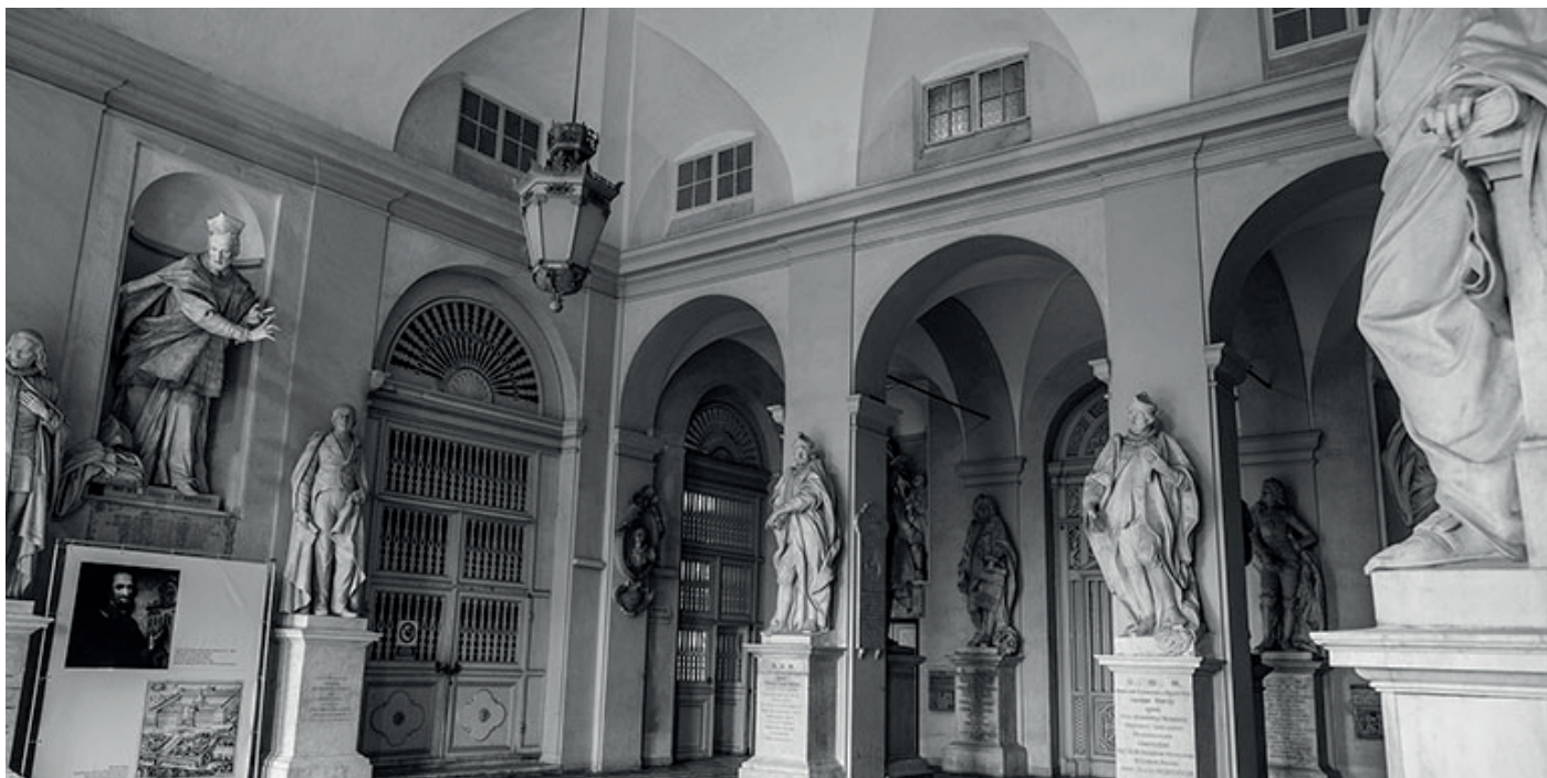
Uno degli spazi più suggestivi dell'Albergo dei Poveri, sotto un'immagine del premio della lotteria di Pasqua del nostro club